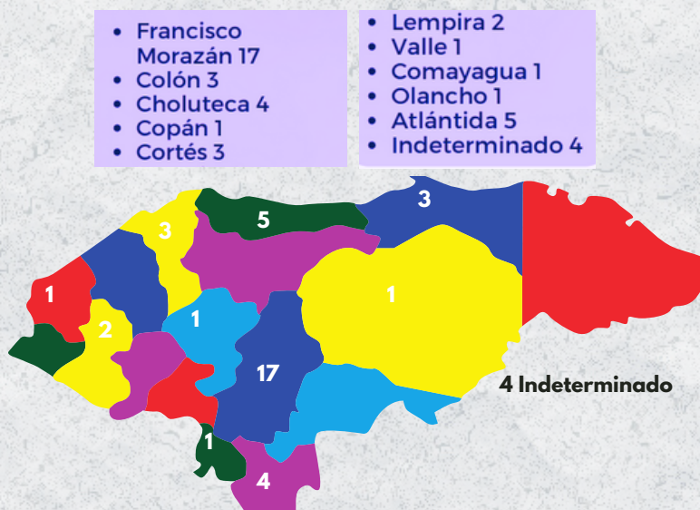
Fuente: elaboración propia con base al 6to informe 2023, de la Unidad de Vigilancia KAI.

El 45% (17) de las muertes violentas fueron perpetradas en el departamento de Francisco Morazán, el 13% (5) en Atlántida, y 10% (4) en Choluteca.