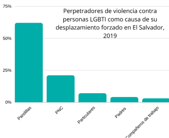
Gráfico elaboración propia con datos del informe 2019 “Huir y sobrevivir” presentado por COMCAVIS TRANS.

los padres y un 3% producto de agresiones por parte compañeros de trabajo.