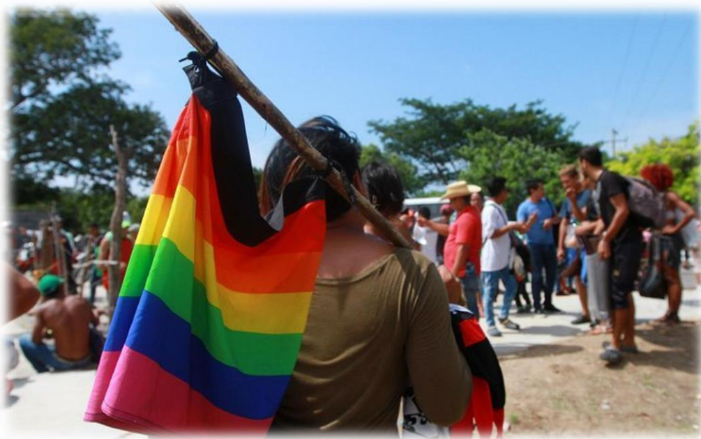
Activista LGBTI en marcha a favor de sus derechos

COMCAVIS TRANS presentó el informe 2019 "Huir y sobrevivir: Una mirada a la situación en El Salvador de las personas LGBTI desplazadas internas y los riesgos que enfrentan".