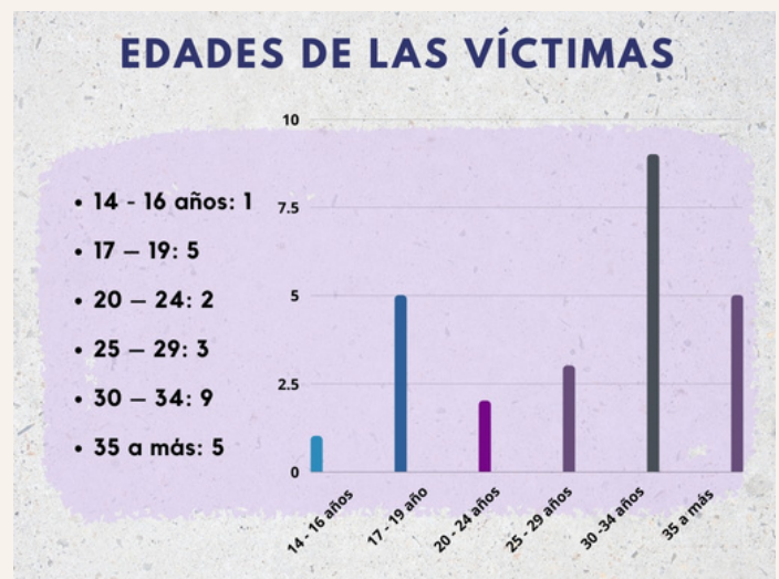
Fuente: Datos recuperados del informe semestral del Observatorio de violaciones a derechos humanos de personas LGBTIQ+ en Nicaragua.

Sobre el acceso a la justicia, de los casos documentados solo 2 personas presentaron denuncias.