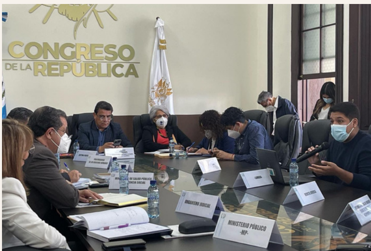
LAMBDA en citación con funcionariado público para verificar la implementación y creación de herramientas para prevenir y responder a la violencia en contra de la población LGBTI.

En Guatemala no están contando a las personas LGBTI, este sería un problema porque los datos públicos no son solo una cuestión de números, si no un reconocimiento que debe realizar el Estado sobre la situación de esta población. En el país, existen más de 300 entidades públicas, sin embargo solamente 9 generan datos sobre población LGBTI. (13).