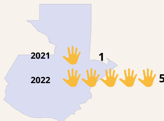
Comparativo de crímenes por prejuicio en Guatemala, septiembre de 2021 y mismo mes 2022